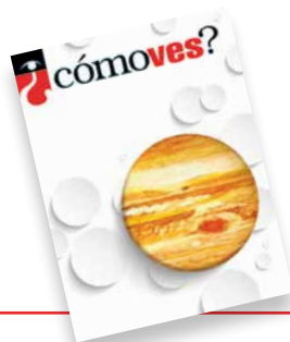
Ilustración: Catya Shok – Skymax/Shutterstock Diseño: Georgina Reyes Coria Año 22 • Núm. 255 • Febrero 2020